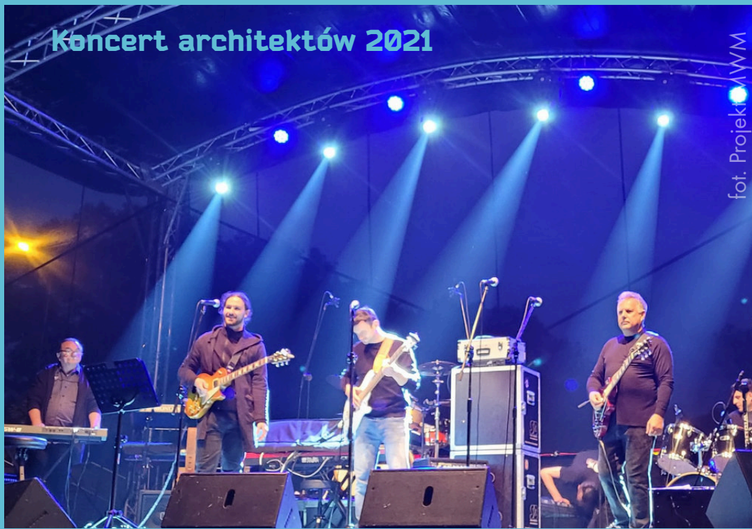
Koncert architektów 2021