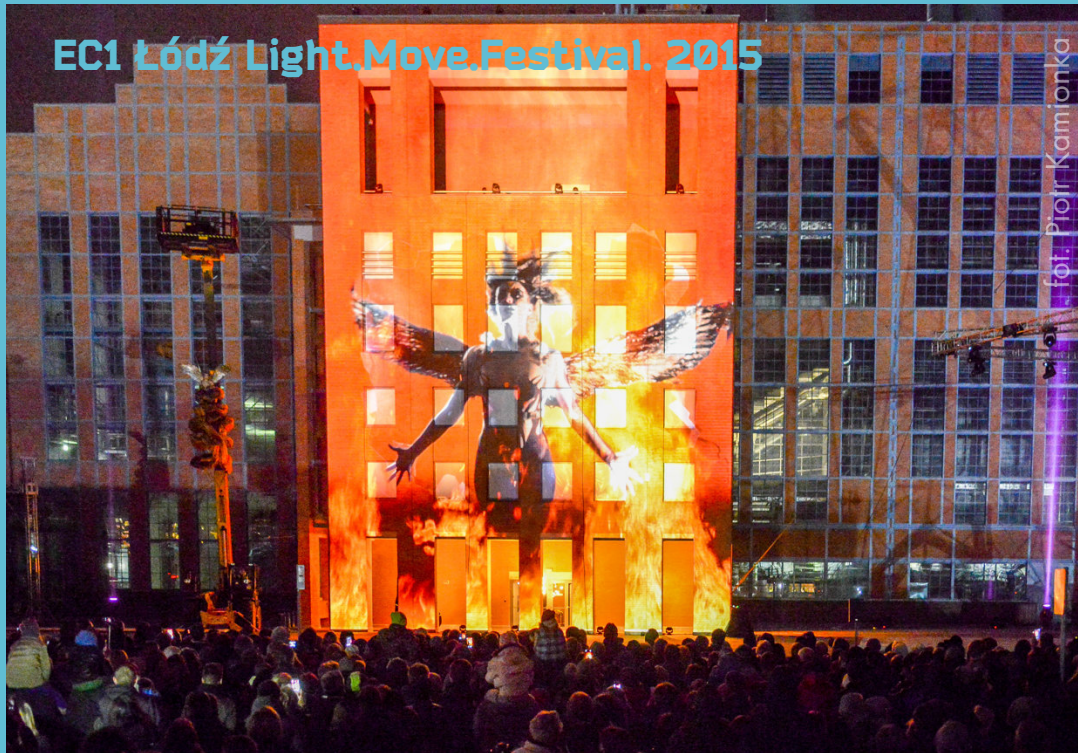
EC1 Łódź Light.Move.Festival. 2015