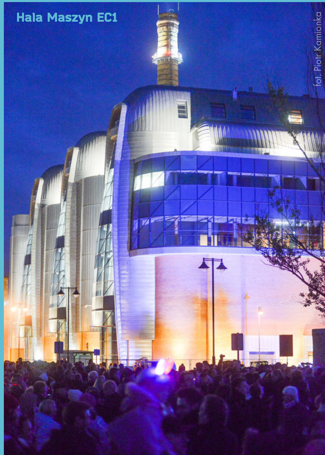
Hala Maszyn EC1